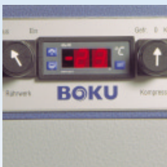
Model MS 863 Modèle MS 863

L e standard le plus élevé en matière de sécurité : touche d'arrêt d'urgence.