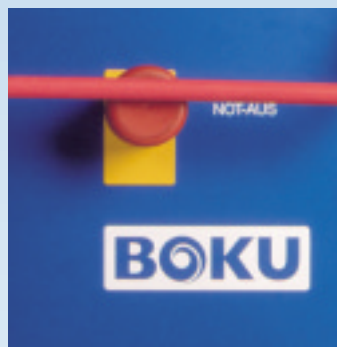
Model MS 41 Modèle MS 41

F acile à reconnaître l'agitateur spiralé BOKU. Nettoyage facile. – Tout reste toujours très hygiénique.