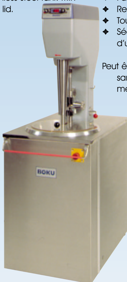
BOKU Ice Cream Machine 863

Also available for installation without refrigeration unit as top drive Type 852 (only stirring mechanism). With tank holder for installation in refrigerated counter with brine tank, BOKU spiral mixing spatula, stainless steel tank with inserted ring and Perspex lid.